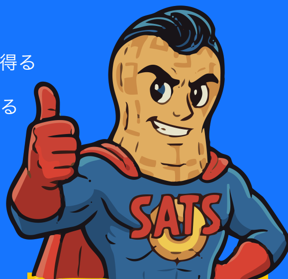
さつぎけん公式キャラクター Captain Satsman